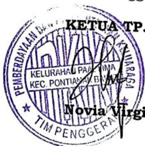
KETUA TP. PKK